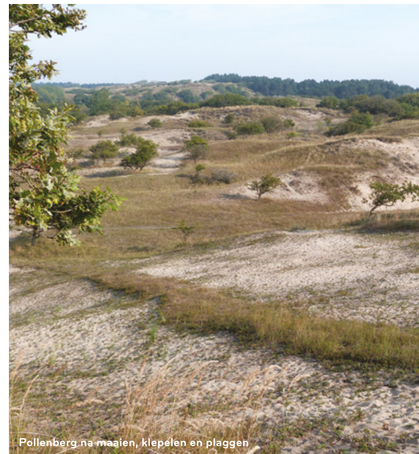
Pollenberg na maaien, klepelen en plaggen

In opdracht van Waternet wordt dit najaar gewerkt in de Middenduinen noord en in het Haasveld. Bomen en struiken worden verwijderd, er wordt gemaaid, geplagd en gebaggerd en graafmachines en zandwagens rijden af en aan. Hoewel u hier wat hinder van kunt ondervinden, is het goede nieuws dat de natuur er uiteindelijk flink van opknapt.